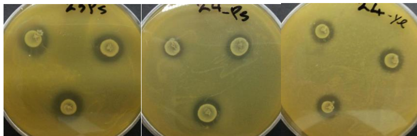
شکل (۱) - قطر هاله عدم رشد باکتری‌های شاخص در پیرامون پرگنه‌های انتروکوکوس

گونه‌های فکالیس، ماندتی، گالیناروم، ساکارولیتیکوس، رافینوسوس، هایرا و آویوم قرار داشتند (نمودار ۱).