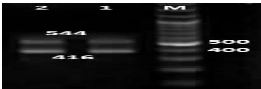
شکل (۱)- ژن‌های sea (قطعه ۵۴۴ جفت بازی) و seb (قطعه ۴۱۶ جفت بازی) در ایزوله‌های استافیلوکوکوس ارتوس (M= مارکر ۱۰۰ جفت بازی، ۱ و ۲= ایزوله‌های مورد مطالعه)

واکنش PCR برای ردیابی ژن‌های فوق در حجم نهایی ۲۵ میکرولیتر شامل ۱ واحد آنزیم Taq DNA Polymerase، ۲/۵ میکرولیتر بافر ۱۰X، ۰/۵ میکرومول از هر کدام از پرایمرها، ۲۰۰ میکرومول dNTP، ۱/۵ میلی‌مول MgCl_2 و ۱ نانوگرم DNA الگو و با برنامه حرارتی ۱ سیکل ۹۴ درجه سلسیوس به مدت ۵ دقیقه، ۳۰ سیکل تکراری ۹۴ درجه سلسیوس به مدت ۲ دقیقه، ۵۰ درجه سلسیوس به مدت ۶۰ ثانیه، ۷۲ درجه سلسیوس به مدت ۶۰ ثانیه و یک سیکل نهایی ۷۲ درجه سلسیوس به مدت ۵ دقیقه انجام گرفت (Asna-ashari et al. , 2012). الکتروفورز محصولات PCR روی ژل آگارز ۱/۵ درصد واجد محلول رنگی DNA safe stain (سیناژن، ایران) در حضور مارکر ۱۰۰ جفت بازی با ولتاژ ثابت ۹۰ ولت به مدت ۱ ساعت انجام گرفت. ژل